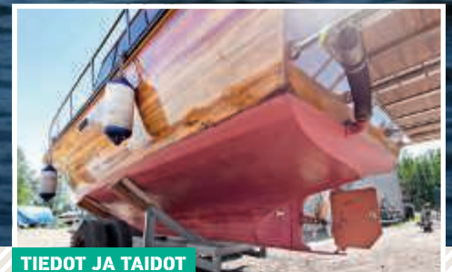
TIEDOT JA TAIDOT